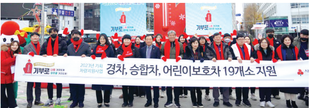
광주사회복지공동모금회는 사회복지현장의 이동편의 증진을 위해 사회복지시설 및 기관 19개소에 차량 지원 사업비 5억9000만원(경차 2대·승합차 12대·어린이 보호차 5대)을 지원했다.