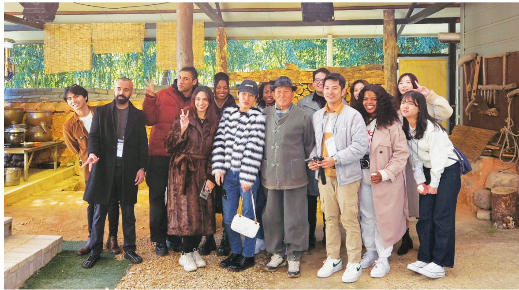
지난 11월 11일 광주시와 담양군 등지에서 1박 2일 간 외국인 33명을 대상으로 남도맛기행 외국인 팸투어가 열렸다.

신청할 정도로 인기가 뜨거웠다. 이번 프로그램을 통해 타 지역민들이 광주·전남 여행을 즐기며 지역 관광 업계 활성화의 불씨를 살렸다는 평가다. 전 국가대표 축구선수이자 방송인으로 활동하고 있는 이천수 씨도 남도맛기행 알리기에 나섰다. 이 씨는 지난 7월 유튜브 채널 ‘리춘수’의 ‘저니맨 리춘수 EP3-광주FC’편에서 1박 2일 일정으로 나주와 광주, 담양을 여행하는 미션투어를 수행하며 남도의 맛과 멋에 푹 빠진 모습을 보여줬다. 나주 목사내야, 담양 메타세쿼이아길·메타프로방스, 광주 양림동 평민마을 등지를 소개하는 이 영상은 25일 기준 36만 회가 넘는 조회수를 달성하며 뜨거운 호응을 얻었다. 올해 사업에서는 지역대학과 연계해 관광 인력 양성에도 힘을 쏟았다. 호남대학교·목포대학교 관광학 전공 학생 20명으로 구성된 ‘매력물탐사대 3기’는 전문가로부터 관광 상품 기획 교육을 거쳐 새로운 지역연계 관광 코스를 발굴하고 이를 기반으로 콘텐츠를 제작했다. 전남대학교와 호남대학교 축제에서는 광주관광 캐릭터 ‘오매나’와 8권역 곳