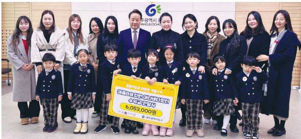
애플B유치원은 지난 22일 소외된 이웃의 겨울나기를 위해 써달라며 '애플B나눔행사' 수익금 600여만원을 동구청에 전달했다. 앞서 애플B유치원은 지난 8일 아너바다 행사 '애플B 나눔행사'를 개최했으며 교사와 학부모, 원아 등 총 200여명이 참여해 기부금을 모았다.