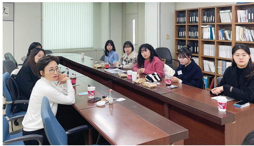
26일부터 본격 활동에 들어간 '제1기 광주일보 대학생 기자단'.