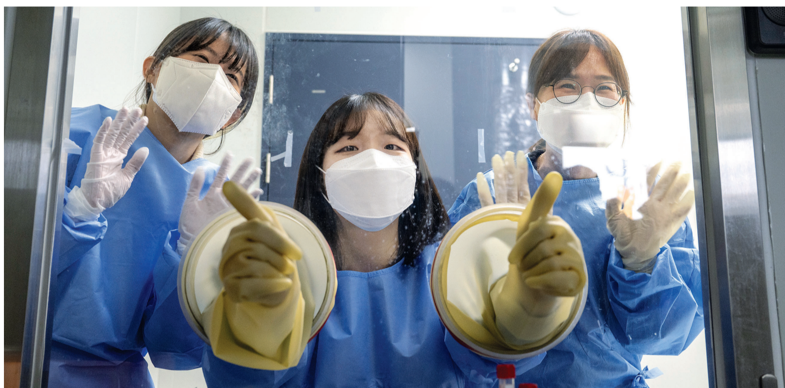
“굿바이~ 선별진료소” 28일 오전 광주 북구보건소 코로나 19 선별진료소에서 의료진들이 운영 종료 안내문을 붙이며 미소짓고 있다. 선별진료소는 오는 31일을 끝으로 운영을 마칠 예정이다.