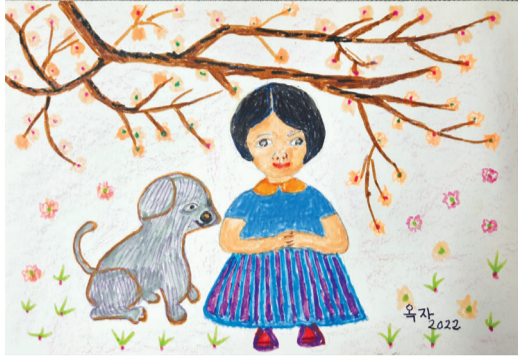
김옥자 작 '내 친구'

올해 아흔 다섯인 김옥자 할머니는 5년 전부터 매일 밤 9시-10시 즈음 ‘감사일기’를 쓴다. 어떤 날은 맛있는 음식을 먹은 것에 감사하고, 어떤 날은 관절염으로 걷기가 불편하지만 지팡이를 쥐고 몇 분 동안이라도 산책할 수 있었던 데 감사의 마음을 전한다. 침대에서 감사일기를 쓰던 지난해 어느 날, 덮고 있던 이불에 새겨진 꽃무늬가 김 할머니의 눈에 들어왔다. 그는 일기를 쓰던 불펜으로 그림을 그리기 시작했다. 이후 노트 한 쪽엔 감사일기를, 한 쪽엔 이런 저런 그림을 그리는 일상이 이어졌다. 우연히 엄마의 노트를 본 김성숙(광주교육대 명예교수) 작가는 깜짝 놀랐고, 스케치북, 사인펜, 크레파스 등을 선물했다. 이후 김 할머니의 본격적인 그림 그리기가 시작됐고, 소박한 전시회도 열게 됐다. 오는 2월 29일까지 보리와 이삭 카페 갤러리(광주 서동구 동계로 12번길 5)에서 열리는 김옥자 초대전 ‘95세 엄마의 그림세상’에서는 지금까지 그린 109점의 작품 중 30여점을 만날 수 있다. “침대 위에 작은 다리미판을 올려 놓고 그림을 그렸지요. 잘 그리지는 못하지만 하나씩 그려보니 재미있더라고요. 하루에 2-3시간 정성들여 그리다보면 무엇보다 정신을 집중할 수 있어 좋아요. 완성하