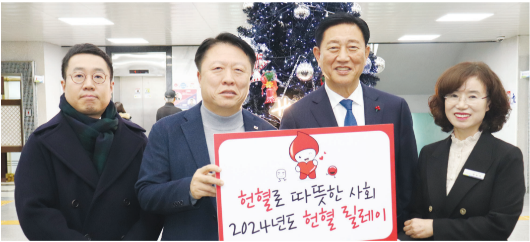
장성군은 지난 2일 시무식이 끝난 후 대한적십자사 광주·전남혈액원(원장 김동수)이 주최하는 '2024년 광주·전남 헌혈 릴레이'에 참여해 단체헌혈을 진행했다.