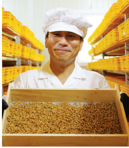
담양에서 식용곤충 가공제품을 생산하고 있는 허누림 오엠오 미래식품전문회사 대표.

현재는 밀월을 사육해 원료를 직접 생산하는 제1사육장, 저온압착추출·급속냉각방식으로 단백질 분말을 생산하는 제2공장 등의 제조시설을 완