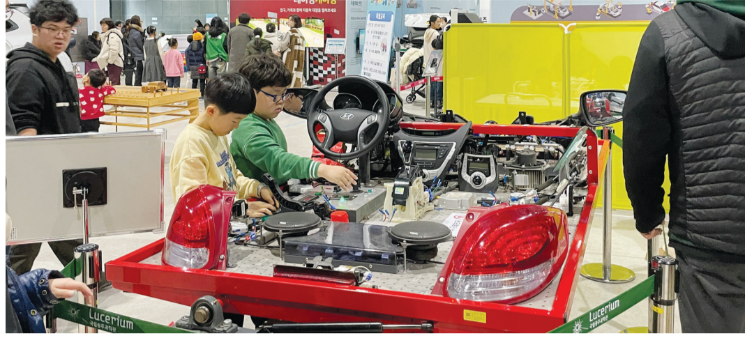
7일 국립광주과학관 '신나는 자동차 세상' 전시를 찾은 관람객들이 호남대학교 미래자동차공학부가 선보인 '자동차 전장 시뮬레이터'를 직접 조작하고 있다.

아이들은 전장 시뮬레이터와 전기자동차 시뮬레이터를 통해 전기차의 컨트롤러, 배터리, 모터 등