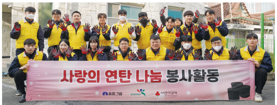
중흥건설 'S-클래스 봉사단'은 지난 5일 북구 풍향동에서 에너지 취약계층을 위한 연탄배달 봉사활동을 했다. 중흥그룹은 지난해 11월 '사랑의 연탄 지원사업'으로 1억 원을 기탁했으며, 광주시 5개 구청을 통해 지역 돌봄 이웃에게 연탄을 전달했다.