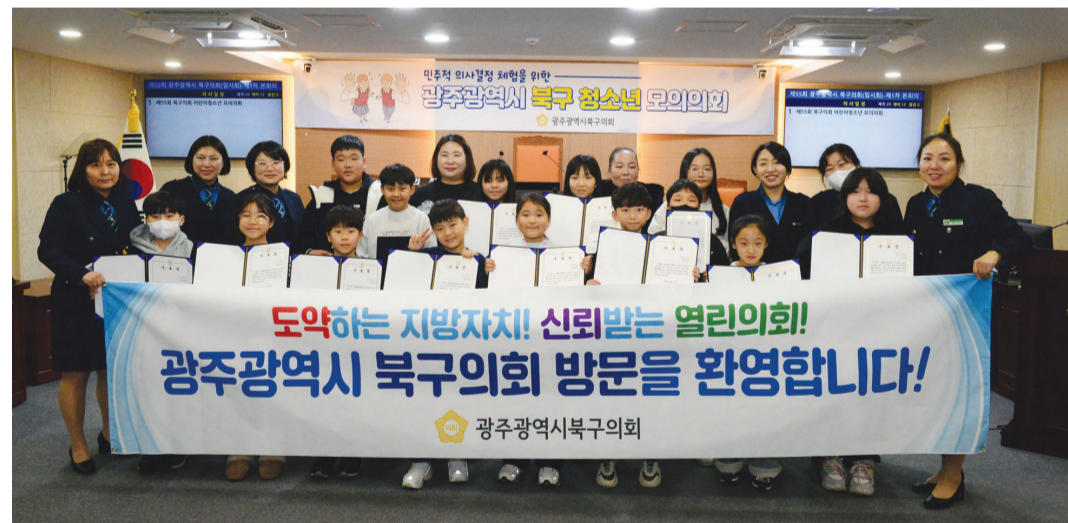
광주북구의회는 최근 광주북부북색어머니회 소속 회원 자녀 14명을 대상으로 민주주의와 지방자치 체험 기회를 제공하는 어린이·청소년 모의의회를 진행했다. 이날 모의의회에서는 의회 공간을 견학하고 주요 업무 추진상황보고 청취, 3분 자유발언 등 지방의회 역할과 기능을 체험했다.