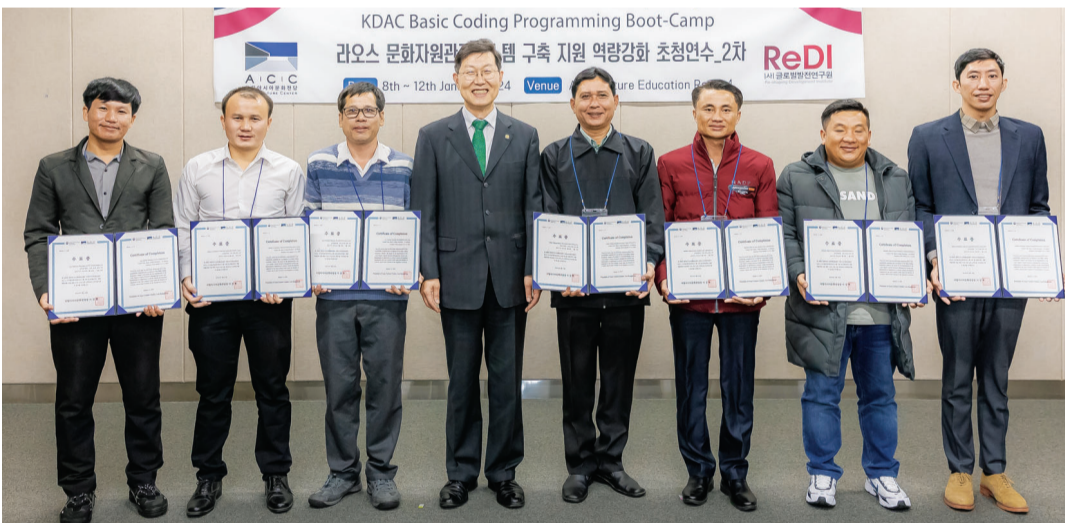
국립아시아문화전당이 지난 8~12일까지 ACC 문화교육실에서 라오스 문화자원관리시스템 관리자 대상 역량강화 연수를 실시했다. 연수는 프로그램 코딩 기초 실습을 중심으로 진행됐으며 교육을 마친 실무자 7명에게 수료증을 전달했다.