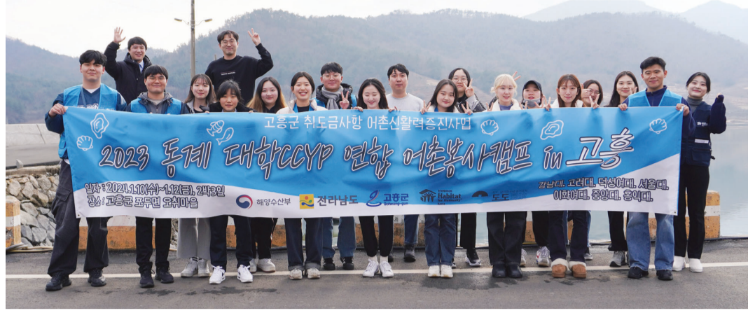
한국해바타트 학생동아리 CCYP는 지난 10~12일 고흥군 포두면 오취리 일대에서 동계 어촌체험캠프를 실시했다.

CCYP는 건축, 브랜딩, 영상 촬영, 봉사활동 팀으로 나뉘어 프로그램을 진행했다. 학생들은 마을 곳곳에 직접 제작한 의자를 설치하고, 독거어르신들의 집을 방문해 집정리와 말벗 활동을 했다. 또 특산물인 ‘굴’을 이용해 마을 캐릭터와 달력, 키링 등 다양한 디자인 상품을 제작했다.