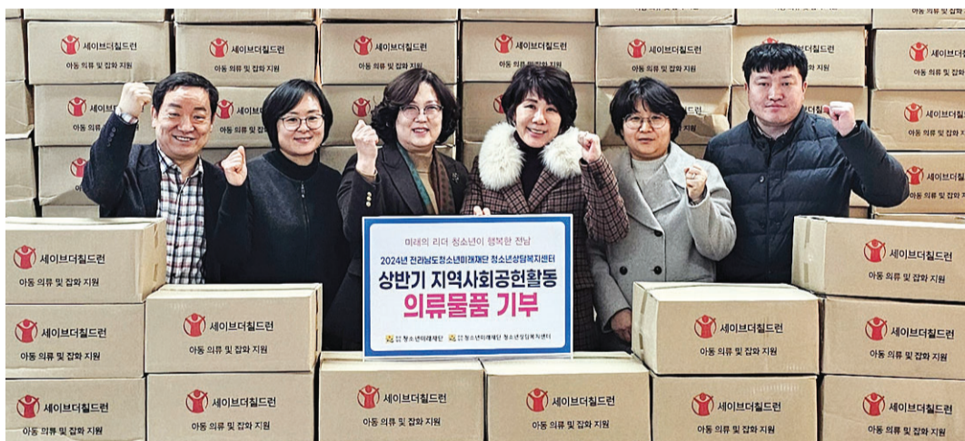
(재)전남도청소년미래재단 청소년상담복지센터가 지난 24일 목포시 용해동 행정복지센터에 의류 물품 127박스를 기부했다. 재단은 오는 2월 8일까지 도내 청소년 유관기관 33개소에 총 542박스를 기부할 계획이다.