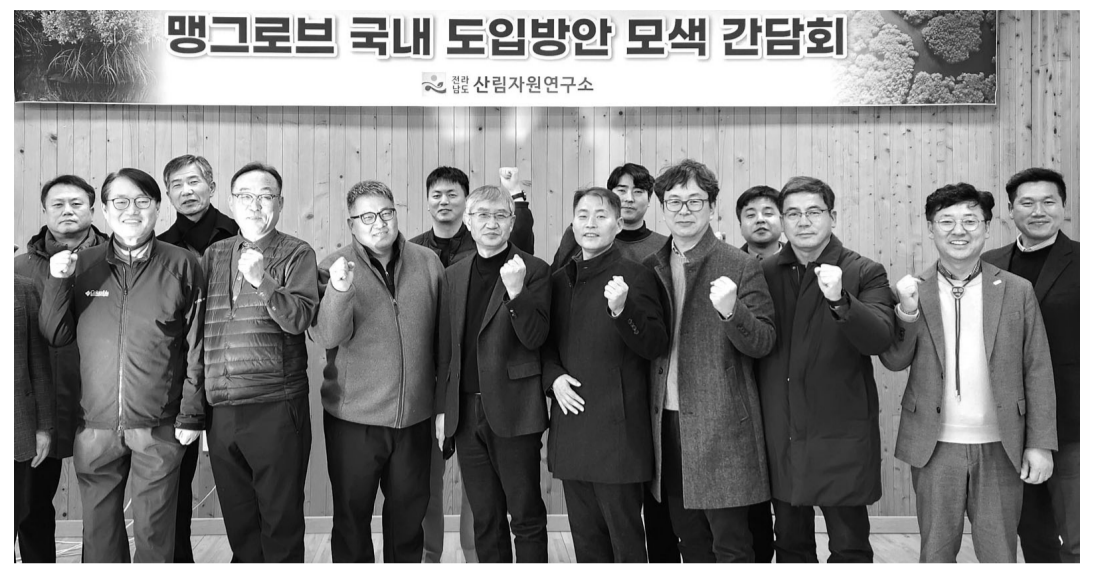
전남도산림자원연구소는 최근 맹그로브 국내 도입 성공 모델을 만들기 위해 관련 전문가들과 회의를 가졌다.