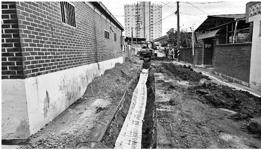
정읍시가 시민들의 연료비 부담 경감 및 삶의 질 향상을 위해 도시가스 공급배관 설치에 박차를 가하고 있다. 도시가스 공급배관 설치 현장.

내년에는 사업비 44억원을 들여 상동 11동 및 장명동, 시기동 일대와 연지동 2·3동, 하모동 일원, 내후년에는 36억원을 들여 시기동 10·12동, 연지 4동, 초산동 6·9동, 금봉동 일원에 공급 배관을 설치할 예정이다.