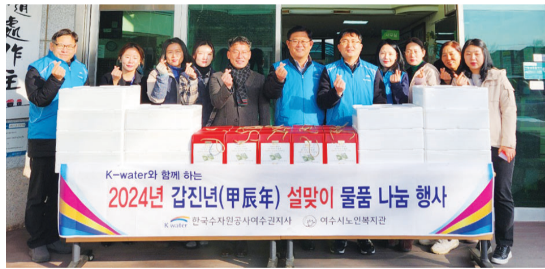
한국수자원공사 영·섬유역본부여수권지사는 지난 30일 여수시노인복지관에서 ‘2024갑진년 설맞이 물품 나눔행사’를 실시했다.