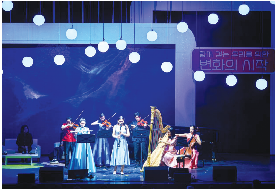
효성 컬처 시리즈 '오은영 토크콘서트 동행'이 지난 3일 마포아트센터에서 열렸다. 이날 행사는 오은영 박사의 '고민 상담쇼', 가운솔로이스트 공연 등으로 이뤄졌다.