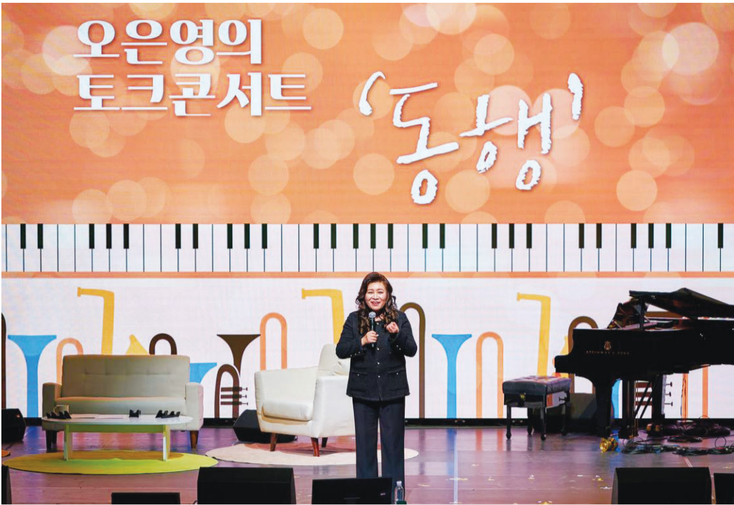
효성 컬처 시리즈 '오은영 토크콘서트 동행'이 지난 3일 마포아트센터에서 열렸다. 이날 행사는 오은영 박사의 '고민 상담쇼', 가운솔로이스트 공연 등으로 이뤄졌다.