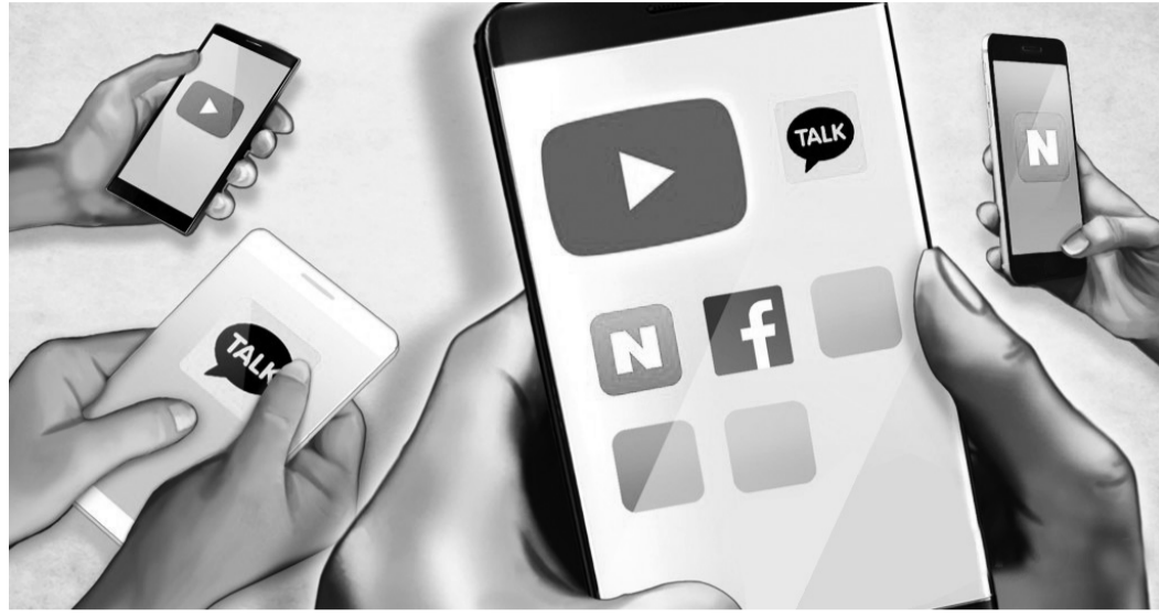
4일 모바일 빅데이터 플랫폼 모바일인덱스가 발표한 통계에 따르면 유튜브가 지난해 12월에 이어 올해 1월에도 국민 메신저 카카오톡을 제치고 국내 앱 이용자 수 1위에 올랐다.

대 이상의 MAU는 카톡이 1위였으나, 9월부터 5개월 연속 유튜브가 30대 MAU 1위를 차지했다. 30대 이용자가 쇼츠를 통해 유튜브로 대거 유입되면서 이러한 변화가 생겼다는 것이다. 유튜브는 음원 플랫폼 시장에서도 1위에 올랐다. 유튜브 뮤직은 지난해 12월 MAU 740만 2505명을 기록하며 멜론(728만 5813명)을 제치고 처음으로 음원 플랫폼 1위에 등극했다. 한편 유튜브는 'OTT 서비스' 만족도에서도 1위를 차지했다. 시장조사 전문기관 컨슈머인사이트가 14세 이상 스마트폰 이용자 3393명을 대상으로 진행한 'OTT 서비스 이용 현황 및 만족도 조사'에서 유튜브 프리미엄이 만족률 69%로 지난해에 이어 1위를 지켰다. 티빙(65%)과 넷플릭스(61%)가 그 뒤를 이었다. /이유빈 기자 lyb54@kwangju.co.kr