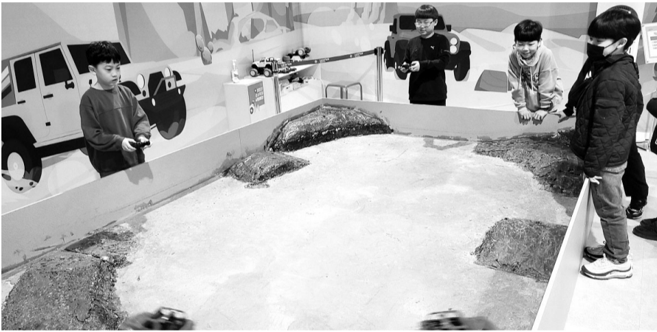
국립광주과학관 자동차 특별전을 체험하고 있는 어린이들.

국립광주과학관(관장 이정구·이하 과학관)은 갑진년 새해를 맞아 관람객을 대상으로 특별 행사를 연다. 과학관은 오는 12일까지 '신나는 자동차 세상' 특별전에 입장하는 만 19세 이상 성인 관람객에게 입장료를 절반 가격에 제공한다. 특별전 관람 후 리뷰를 작성하고 인증하는 선착순 10명을 대상으로 매일 소정의 기념품도 제공한다.