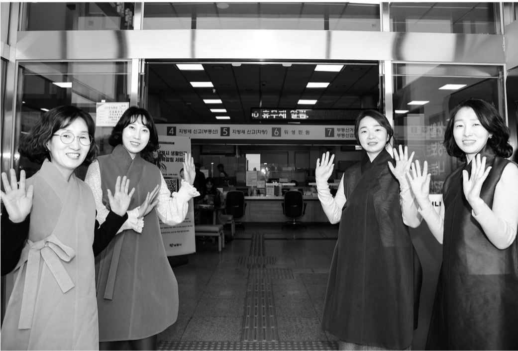
남원시 민원실 직원들이 고운 한복을 입고 민원인을 맞이하고 있다.

이와 함께 올해 춘향제는 행사기간이 5일에서 7일간으로 확대됨에 따라 더욱 풍성하고 다양한 프로그램을 보고 즐길 수 있도록 민원실 현관입구와 실내에 홍보용 배너를 설치함으로써 오고 가는 방문객들에게 참여를 유도할 계획이다.