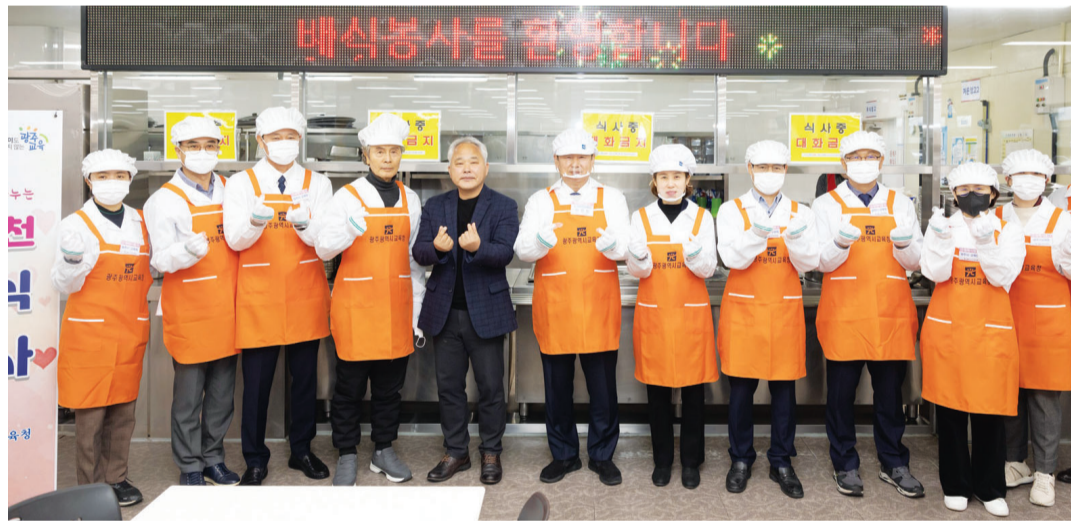
이정선 광주시교육감이 5일 광주시 남구 빛고을노인건강타운에서 ‘효실천 배식 봉사’를 진행했다. (광주시교육청 제공)