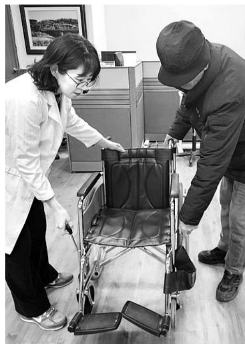
남원시보건소 재활운동실을 찾은 한 시민이 휠체어를 대여하고 있다.