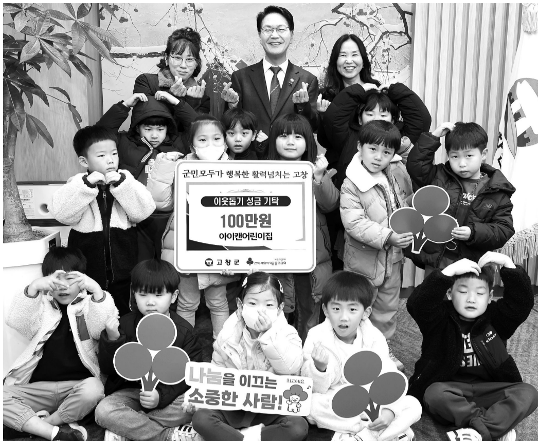
고창군 아이케어아이집 원아들과 교사가 '희망 2024 나눔캠페인' 성금을 기탁한 후 심덕섭 고창군수와 함께 기념촬영을 하고 있다.

모아진 성금은 전북사회복지공동모금회를 거쳐 관내 저소득 계층이나 복지 사각지대 이웃, 취약