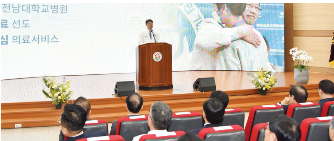
전남대학교병원 료 선도 심 의료서비스

이 점차 줄어들고 있다. 윤 회장은 900년 역사의 별신제가 후손에 전해질 수 있도록 주민들과 함께 노력을 멈추지 않겠다는 의지를 전했다. “예전엔 초등학교생들도 농악판에 나와 춤을 추곤 했죠. 이제는 마을에 젊은사람들이 많지 않다는 게 안타까울 따름입니다. 우리 마을을 대표하는 전통 문화인만큼 앞으로 힘 닿는 데까지 별신제를 이어나갈 것입니다. 그 맥을 잇는 게 보존회의 역할이니까요.” /이유빈 기자 lyb54@kwangju.co.kr