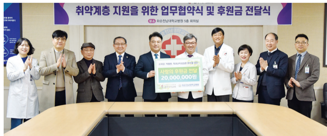
취약계층 지원을 위한 업무협약식 및 후원금 전달식

에서도 묵묵히 최선을 다해주고 있는 5600여명의 직원들께 감사드린다”며 “공정인 인사관리 부서를 신설하는 등 직원들과 소통창구를 적극적으로 마련하겠다”고 밝혔다. 병원 운영 계획으로는 ▲병원별 특성화·전문화 및 의료질 향상 지원체계 강화 ▲글로벌 의료인재 양성 ▲미래형 스마트 병원 준비 ▲체계적인 인사관리와 소통 강화 등을 제시했다. /김민석 기자 mskim@kwangju.co.kr