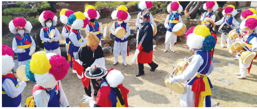
900년 전통의 '장좌 기반이 별신제'를 이어오고 있는 별고 장좌마을.

가 보존되지 않아 포기하기도 합니다. 장좌마을은 수백년 전통이 사라지지 않도록 주민들이 끊임없이 노력하고 있죠.” 장좌 기반이 별신제는 공동체적 종교성과 축제적 신명을 잘 갖추고 있다. 그 전통과 예술성을 인정받아 지난 1989년 남도문화제에서 최우수상을, 1990년 전국민속예술경연대회에서 문화부장관상을 수상하기도 했다. 장좌마을은 매년 음력 정월 초엿새날이면 소동회를 열어 별신제를 모실 당주, 제관, 축관 등을 정한다. 이들은 이날부터 몸과 마음을 깨끗이 하고 초상과 출산은 마을 밖에서 치러야 할 정도로 금기가 엄격하게 지켜져 왔다. 초엿새날 새벽에는 집귀가 마을에 들어오는 것을 막기 위해 골목마다 황토를 놓고 음력 열나흘날 밤부터 이튿날 새벽까지 제사를 모신다.