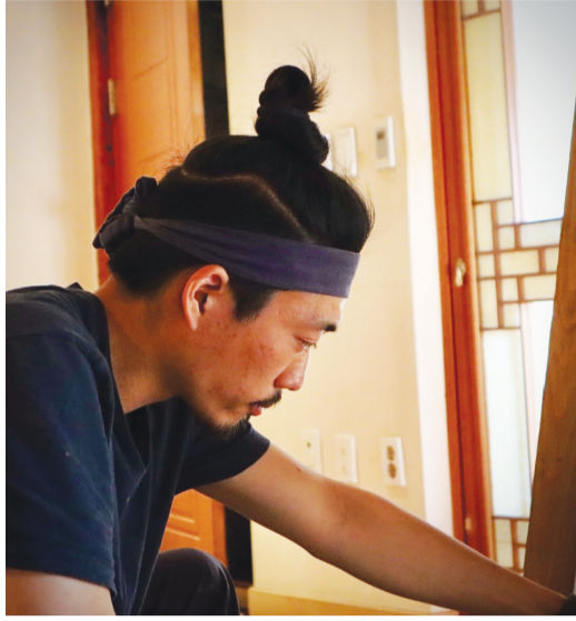
에 대한 관심과 연구가 절실하다고 강조했다. 전통 한옥과 달리 근현대 생활한옥들은 그 문화적 가치를 인정받지 못한채 철거되고 있다는 것. “전통한옥은 보존이 잘 돼있지만 근현대 주택들은 외국 문화의 영향을 받았다는 이유로 그 가치가