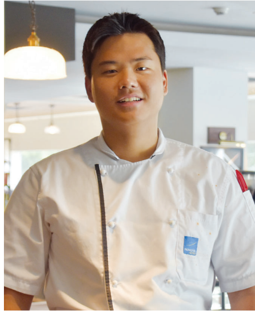
우고 싶다는 생각으로 호주 요리학교 입학을 앞두고 있는데 스스로 학비를 해결하기 위해 일을 하고 있습니다. ‘배움’을 위한 길을 걷고 있는 김 셰프에게 KIA

다. ‘3일 훈련 1일 휴식’이라는 선수단 스케줄에 맞춰 생활하면서 아침과 저녁을 담당했다. 그는 선수들과 같이 움직였다. 8시까지 저녁을 담당하고, 다음날 아침까지 준비했다. 선수들이 국그릇까지 짝 비울 정도로 입맛에 딱 맞는 요리를 준비한 그는 아직 경험보다는 열정이 넘치는 셰프다. 본격적으로 요리를 한 지는 4년 정도. 지난해 3월 요리를 세밀하게 배우기 위해 호주로 건너왔다. “요리 전공은 아니고 경제학과인데 상하 관계 이런 게 싫어서 취업은 하기 싫었죠. 창업을 해봤는데 적성에 맞았어요. 요식업 창업은 하려면 요리를 해 봐야겠다고 생각했습니다. 부모님이 자영업을 하셔서 저절로 요리와 친해졌어요. 또 8~10시간 서서 일하는 직업인데 체력도 잘 따라왔죠. 더 세밀하게 배