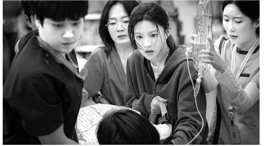
상반기 공개 예정인 tvN 드라마 '언젠가는 슬기로울 전공의생활'