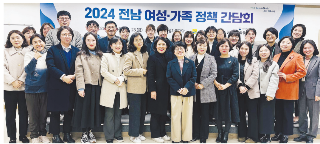
(재)전남여성가족재단이 지난 23일까지 1박2일간 1차와 2차로 나눠 시·군 여성가족 주무부서 공무원과 함께 정책 현안을 논의하는 간담회를 개최했다. 이번 간담회는 사·군의 2023년 우수사례 및 2024년 신규 시책 소개, 참가자들의 열린 질문과 토론 등의 순으로 진행됐다.