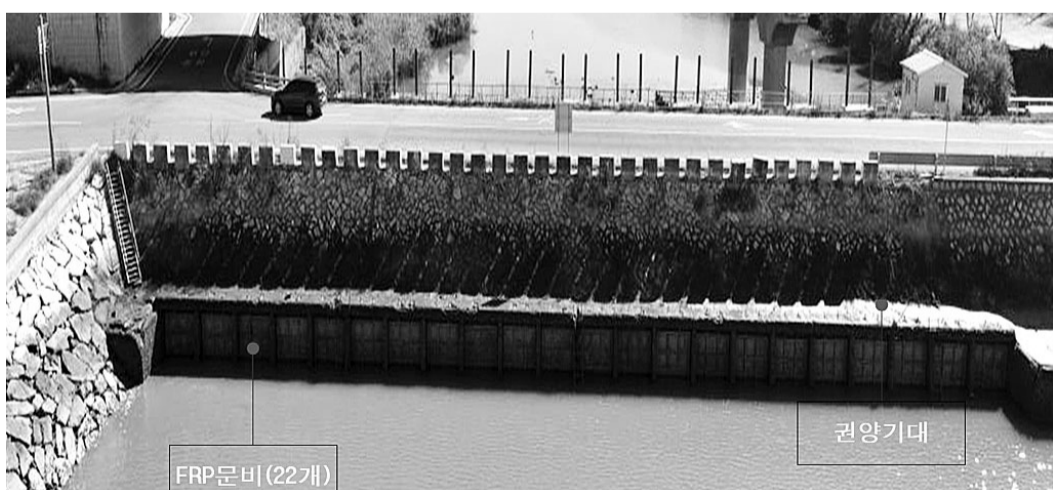
오는 2028년까지 개선 공사를 벌이는 무안 창포 방조제 배수갑문.

와 배수갑문을 개보수해 시설물의 붕괴와 파손을 방지하고, 바닷물의 유입으로부터 농경지를 보호할 수 있다.