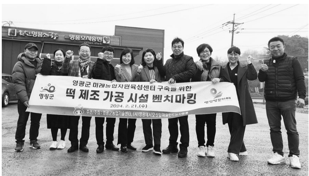
영광군과 사단법인 '영광에서 모싯잎송편을만드는사람들' 관계자들이 충남 서천 명품모시식품 영농조합법인을 찾아 기념 촬영을 하고 있다.

참석자들은 시설 견학을 통해 '모시떡 제조 자동차화 장비'에 대한 설명을 듣고, 영광군 미래농업자원육성센터 떡 상품 개발 시범장 설비 구축 방안을 모색했다. 또 다양한 떡 가공제품 개발과 상품화에 적용할 수 있는 공동 시설 활용방안에 대한