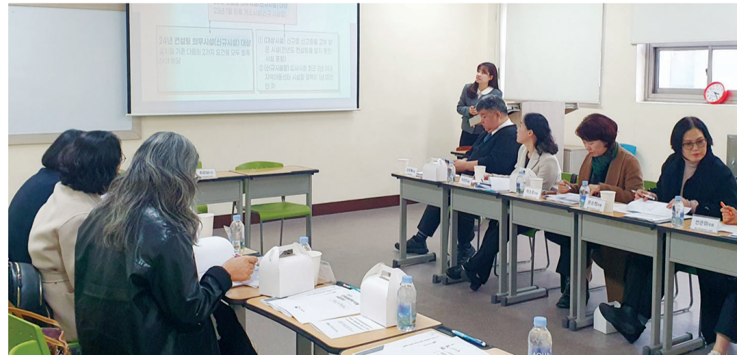
남부대학교 산학협력단 지역아동센터광주지원단은 최근 지역아동센터 현장 및 관련전문가로 구성된 지역아동센터 컨설팅위원 교육 및 간담회를 개최했다.