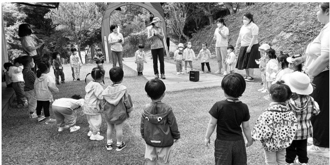
정읍사공원 내 유아숲체험원에서 어린이들을 대상으로 체험프로그램을 진행하고 있다.

정읍시가 어린이들의 정서적 교육과 신체적 성장을 돕고자 올해도 정읍사공원 내 '유아숲체험원'을 본격 운영한다. 유아숲체험원에는 그늘놀이대, 로프놀이대 등 아이들이 즐길 수 있는 친환경 놀이시설이 마련돼 있다. 시는 이를 통해 유아숲지도사와 곤충, 흙, 나무 등 자연을 체험하고 학습할 수 있는 프로그램을 마련해 어린이들의 만족도를 높일 계획이다. 지난 2019년 정읍사공원 내에 조성된 유아숲체험원은 매년 유아숲 체험 프로그램을 운영하며 어린이들의 인기를 끌고 있다. 올해는 4월~13일 지역 유치원·어린이집을 대상으로 정기반 대상자를 모집하고 선정된 유치원과