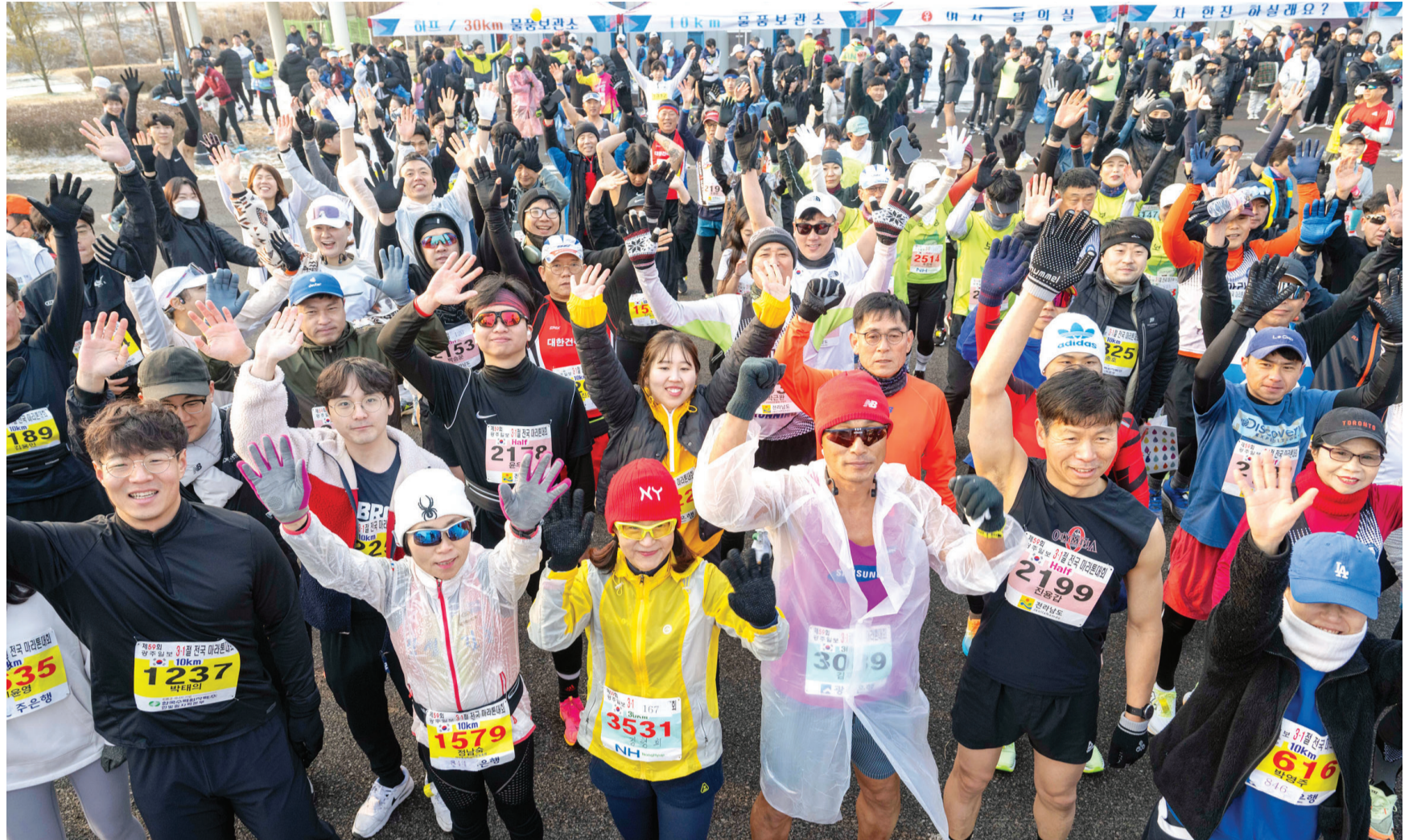
만세 삼창 제59회 광주일보 3·1절 전국 마라톤대회가 3일 오전 화순 청풍면 K-water 홍수조절지에서 열렸다. 출발에 앞서 주자들이 몸풀기 운동을 하며 환호하고 있다.