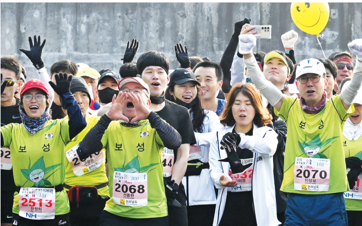
뜨거운 출발 함성 20km 종목에 출전한 주자들이 출발에 앞서 함성을 지르고 있다.