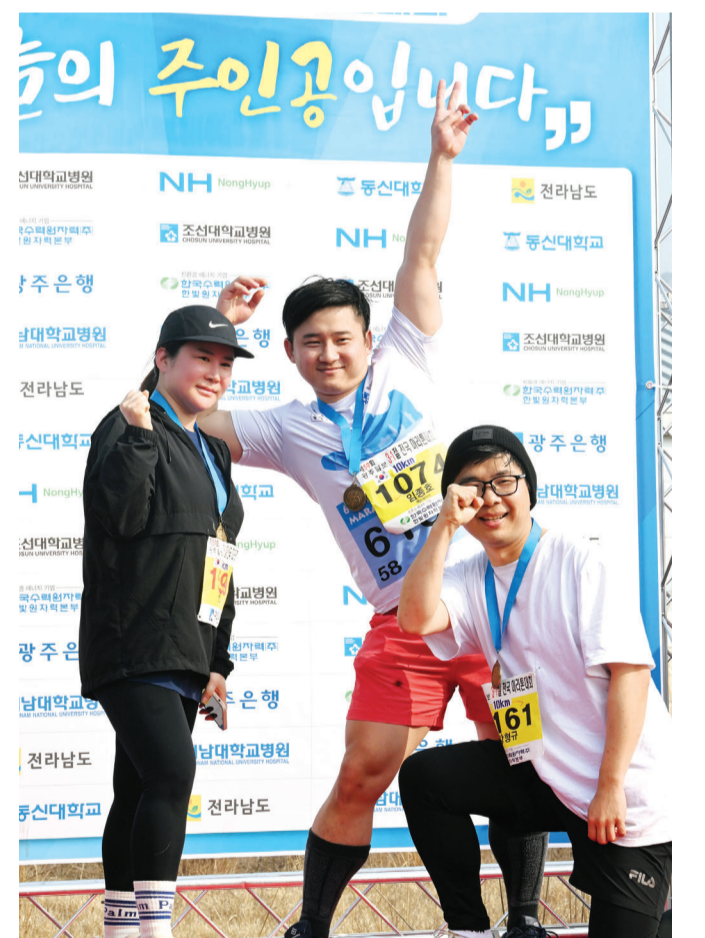
포즈는 금메달 10km 질주를 끝낸 주자들이 완주 메달을 목에 걸고 포토존에서 포즈를 취하고 있다.