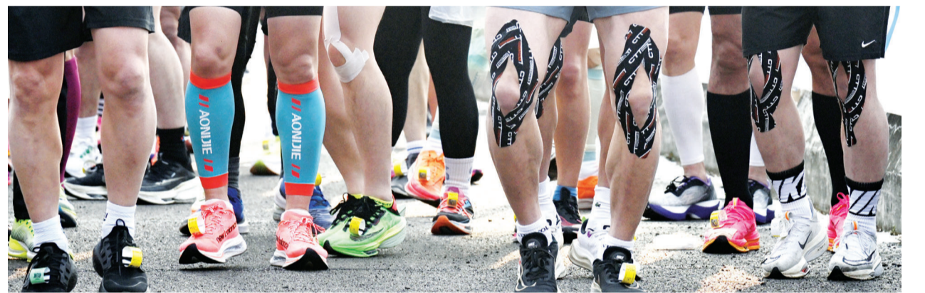
출발선 앞에서 10km 출발에 앞서 주자들이 무릎 운동을 하고 있다.