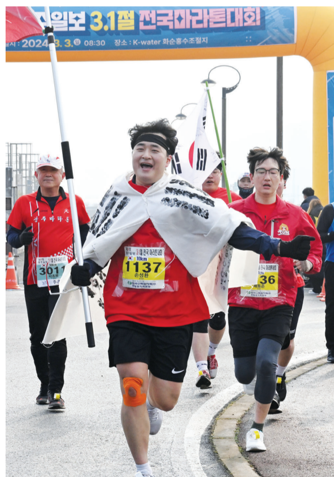
태극기 휘날리며 10km 종목 주자가 태극기를 목에 두르고 3·1절의 뜻을 되새기며 달리고 있다.