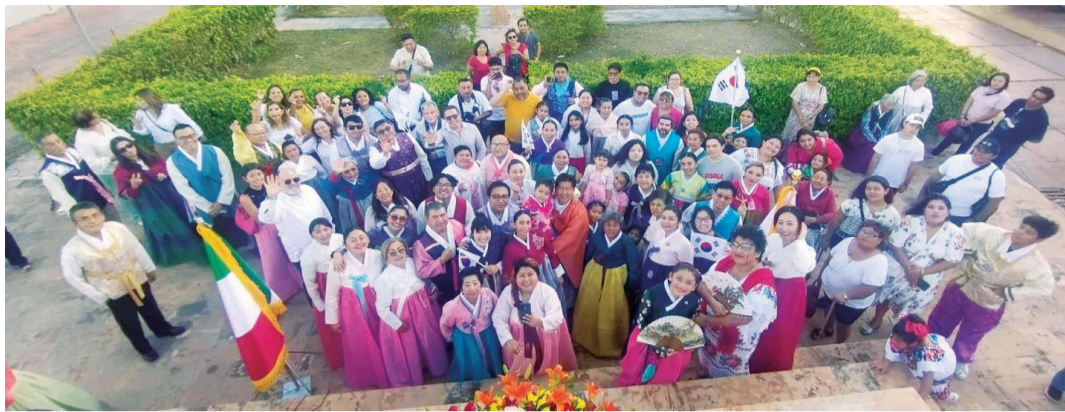
광주에서 보낸 한복을 입고 3·1절 기념식을 개최한 멕시코 한인 후손들.

달했다는 사실을 밝혀냈다. 이후 여러 차례 멕시코를 방문했던 김 교수는 3·1절 기념식에 참석했다. 정체불명의 한복을 발견했다. 후손들은 사라져버릴 역사를 기억하기 위해 매년 3·1절과 국치일(8월 29일)에는 한복을 입고 기념식을 열었다. “기념식에 할머니 할아버지가 입었던 한복을 입고 나왔는데 안타까웠어요. 광주에 돌아와 한복 관계자 등에 문의해보니 한복이라고 할 수 없다는 거예요. 우리 민족을 상징하는 게 한복인데 이거 아니다 싶었습니다. 제대로 된 한복을 보내주면 좋겠다고 생각했죠. 힘들었던 삶 속에서도 광주학생독립운동을 지원한 그들의 고마움을 갚는 일이기도 하구요.”