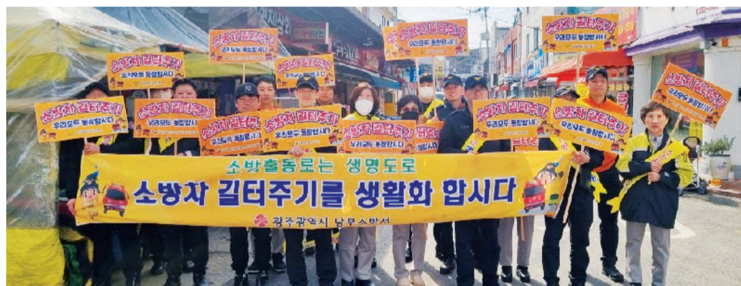
광주남부소방은 최근 무등시장에서 의용소방대원, 시장 상인회 관계자들과 차량 정체구간에 대한 ‘소방차 길 터주기’ 출동훈련과 캠페인을 실시했다.