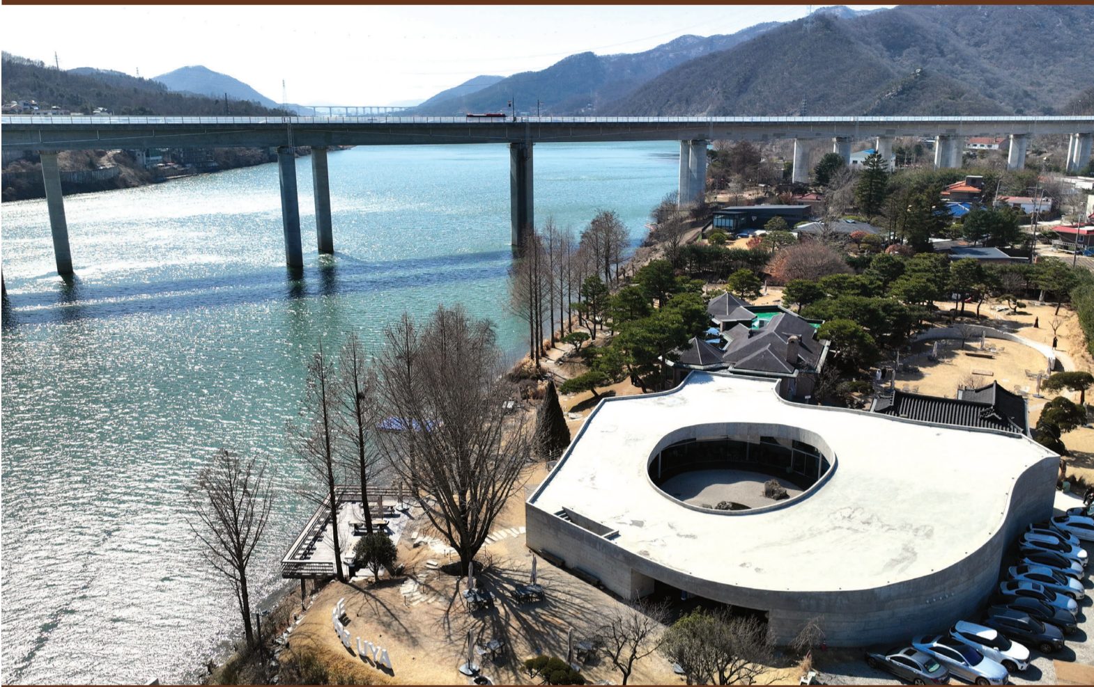
경기 남양주 '이색 카페'