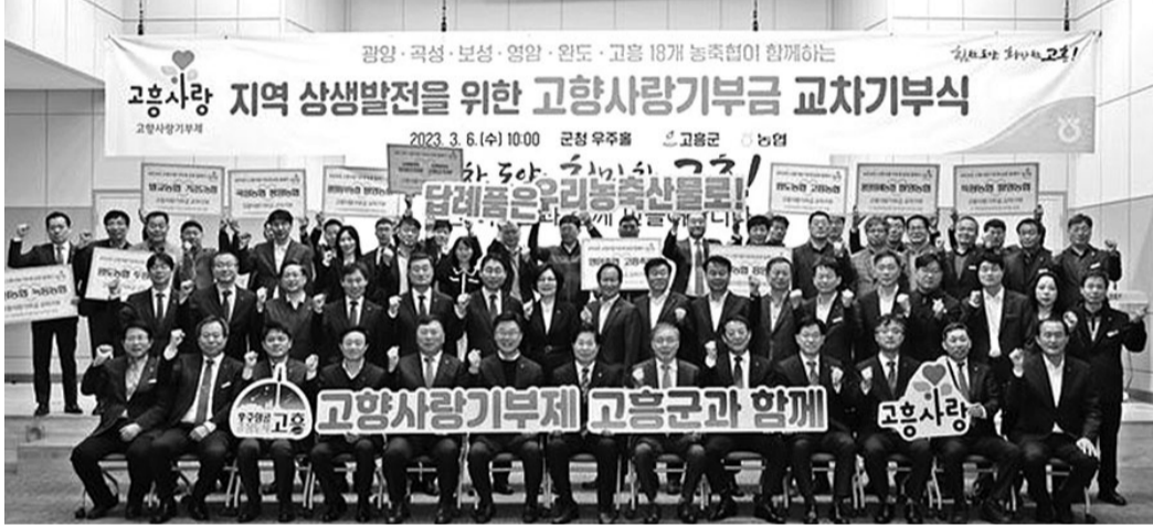
지난 6일 군청 우주출에서 전남 6개 지역 농협중앙회 시군 지부장과 16개 농·축협 조합장, 임직원 등이 참석한 가운데 '고향사랑기부금 교차 기부식'이 열렸다.

광양시가 2024년 청년 취업자 주거비 지원사업 대상자를 모집한다. 청년 취업자 주거비 지원사업은 전·월세 주택에 거주하고 있는 청년에게 월 20만원씩 최대 12개월간 240만원의 주거비를 지원하는 사업이다. 올해 모집인원은 53명이며, 신청자가 많을 경우 자격요건을 모두 충족한 신청자 중 가구소득인정액이 낮은 순으로 선정된다. 신청자격은 광양시에 주소지를 둔 18세 이상 45세 이하 청년 노동자 및 사업자로 가구소득인정액이 기준중위소득 150% 이하이며, 전세 대출금 5000만원 이상 또는 월세 60만원 이하 주택에 거주하는 무주택 청년이다. 신청일 기준 신청자격을 모두 충족해야 하며 ▲저소득층 주거급여 대상자 ▲국가 및 지방자치단체에 근무하는 공무원 및 공무원 ▲주거 관련 금융지원 대상자(기금대출) ▲정부 및 지자체의 주거 관련 유사 사업 대상자 등은 신청 대상에서 제외된다. 신청을 원하는 대상자는 오는 11일부터 22일까지 제출서류를 구비해 주소지 읍면동사무소에 방문 신청하면 된다. /광양=김대수 기자 kds@