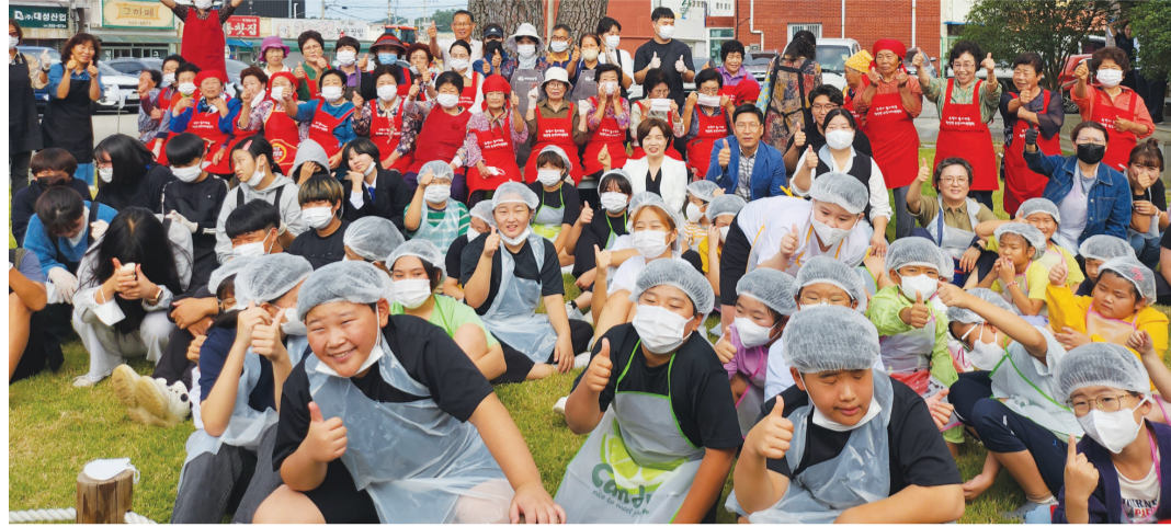
해남군 화산면은 지난 6일 '주민과 함께하는 화산면, the 행복한 면민' 프로젝트로 전남도 현장 행정 평가에서 대상을 받았다.

는 '주민과 함께하는 화산면, the 행복한 면민' 프로젝트를 통해 '신나부러 노래교실', '꽃매정촌합창단', '땅끝 희망이 자원순환 사업' 등 다양한 활동을 펼쳤다. 화산면은 이러한 노력을 인정받아 지난 6일 전남도 주관 현장 행정 평가에서 대상을 받았다. “할 수 있는 것에 집중하고 나섰기에 다양한 문제를 해결할 수 있었어요. 지역소멸, 청년유출같은 거 대담론보다는 당장 주민들이 원하고, 체험할 수 있는 문제를 들여다봤지요.” 주민들이 밭 밷고 나선 결과, 한자릿수에 불과했던 학생들은 어느새 십여명 가까이 늘었다. 화산(花山)이라는 이름 그대로 웃음꽃 피는 마을이 된 것. 화산면에선 모두가 수혜자임과 동시에 봉사자다. 아이들은 어르신들에게 한글과 영어를 알려주는 선생님이 되고, 할머니들은 텃밭에서 가꾼 싱싱한 채소로 아이들의 도시락을 정성껏 준비한다.