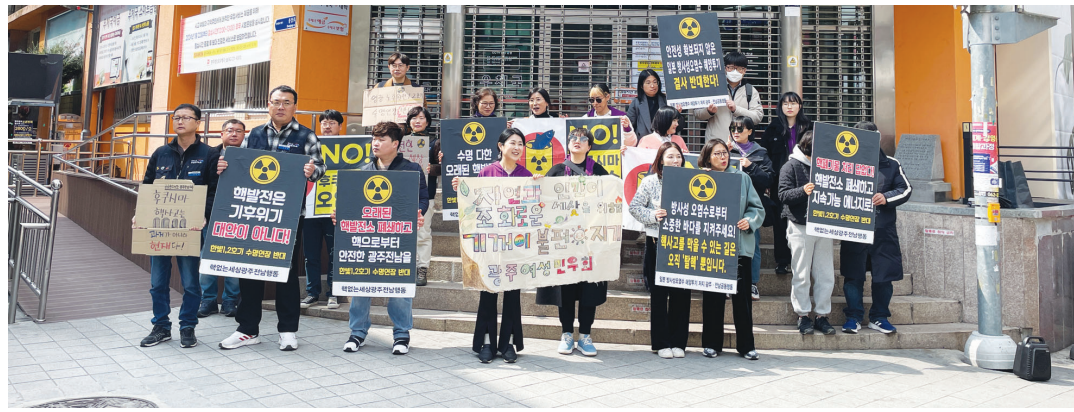
최근 광주충장으로 우체국 앞에서 열린 ‘한빛 1·2호기 수명연장 거리 선전전’.

“에코백이나 텀블러를 단지 ‘사용’하는 것에서 한 발자국만 더 내딛어 보세요. 카페에서 플라스틱 빨대를 찾을 때 ‘다회용 빨대가 있어서 괜찮아요’ ‘일회용품 사용을 자제하고 있어서요’라는 한마디로