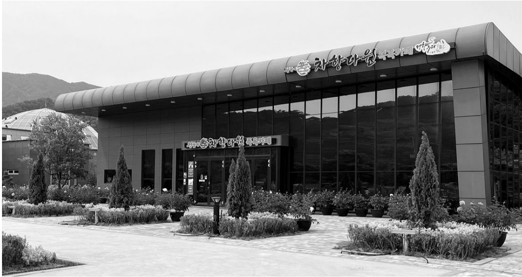
정읍시 임산물체험단지에서 오는 20일부터 임산물 등을 활용한 다양한 체험 프로그램이 진행된다. 정읍시 임산물체험단지 전경.

특히 올해는 나만의 개성을 살린 모루인형 만들기, 힙팟(HipPot) 만들기 등 새로운 트렌드에 발