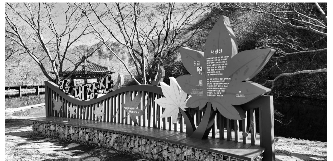
국립공원 내장산 우화정 앞에 세워진 내장산 노래비.

'동넙바람~ 불어오면 곁에 물든 내장산아~' 국립공원 내장산 우화정 앞에 포토존과 함께 '내장산 노래비'가 설치돼 방문객들의 눈길을 끌고 있다.