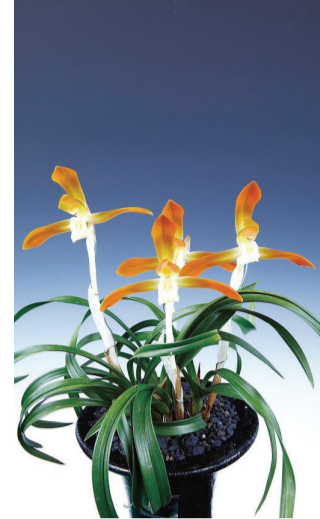
대상 작(주금소심-태홍소).

적당한 관심이 중요하다는 게 그의 생각이다. 그는 끝으로 난입문자들에게 "처음에는 저가의 난 종류로 도전해 난 키우는 법을 익히고, 한 단계 한 단계 고급 품종으로 나아가보라고" 귀띔했다. 한편 신안은 한반도 멸종위기 난과 식물 22종 중 40%를 차지할 정도로 멸종위기 자생란의 보고라고 불린다. 신안군은 매년 1004섬 촌란전시, 전국 새우란 대전, 전국 새우란 축제, 여름 새우란 전시, 대한민국 자생란 대전 등 다양한 자생식물 전시행사를 개최하고 있다. /이유빈 기자 lyb54@kwangju.co.kr