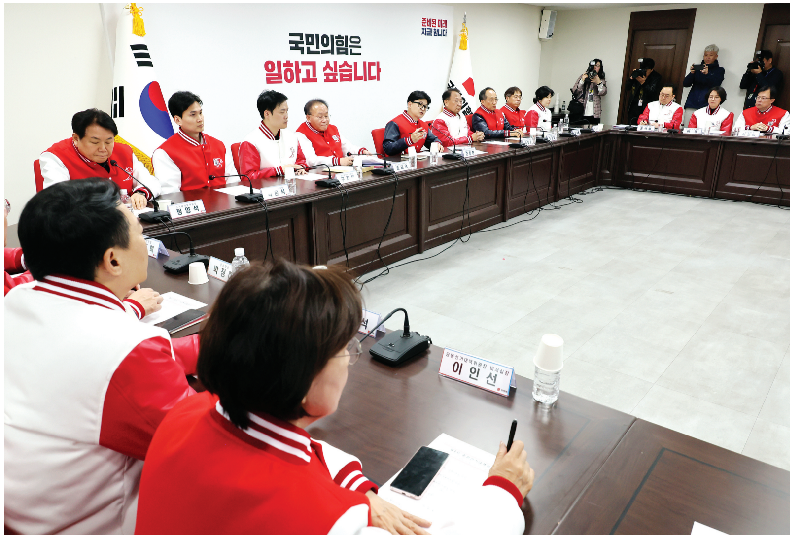
국민의힘 한동훈 비상대책위원장이 24일 서울 여의도 중앙당사에서 열린 중앙선거대책위원회에서 발언하고 있다.