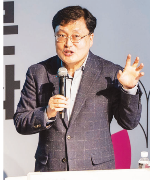
강연을 진행하고 있는 강용수 철학자.

한 인간관계를 정리하라고 했지만, 그것이 외톨이 처럼 홀로 지내라는 것은 아니라고 강조했다.