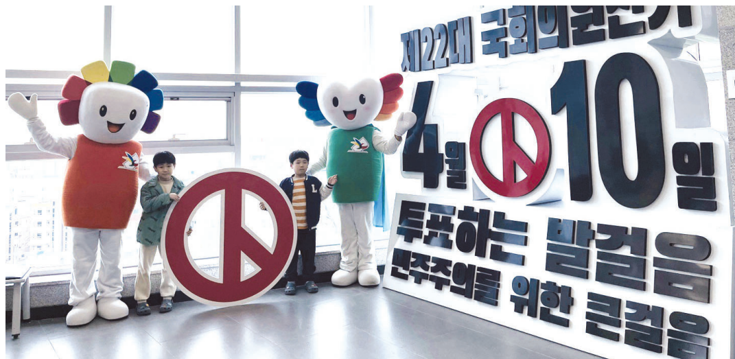
전남도선거관리위원회는 목포해상케이블카 승강장 앞에서 제 22대 국회의원 선거일 등이 담긴 조형물을 설치하고 관광객을 대상으로 투표 참여 홍보활동을 벌였다.