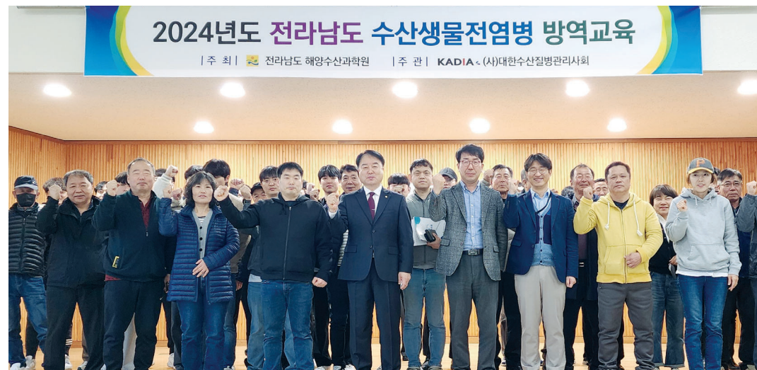
전남도해양수산과학원이 최근 여수에서 수산생물 양식어업인 등을 대상으로 ‘수산생물 질병 방역교육’을 실시했다.