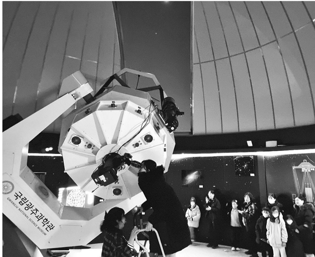
4월 과학의 달을 맞아 한 달간 다양한 과학 프로그램이 진행된다. 사진은 국립광주과학관 별빛천문대에서 천체관측하는 모습.

과학기술문제를 풀어보는 '과학오락실', '다가오는 미래 과학 트렌드', 과학이슈에 대한 의견을 나눌 수 있는 '과학이 담긴 미래 그려보기' 등 누구나 즐길 수 있는 콘텐츠가 마련된다. SNS 이벤트도 함께 진행된다. 4월 한 달간 과학관 등 행사장에 방문하거나 과학체험을 하는 사진을 인스타그램에 해시태그와 함께 업로드하면 추첨을 통해 참여자에게 다양한 경품이 제공될 예정이다. 대표적 과학축제인 '2024 대한민국 과학축제'는 25일부터 28일까지 대전 엑스포시민광장 및 엑스포과학공원에서 개최된다. 21일 과학의 날 전후로 전국 5개 국립과학관에 무료 입장이 가능하며 광주과학관은 20일과 21일 이틀간 무료로 입장할 수 있다. '2024 봄날의 과학산책'과 전국 과학의 달 프로그램에 대한 자세한 정보는 과학문화 누리집 사이언스올에서 확인할 수 있다. /양재희 기자 heestory@kwangju.co.kr