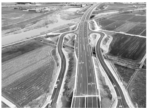
주천→하모 교차로 방향.

2.23km 신설도로 내일 개통...상승 지·정체 해소 기대 국토교통부 익산지방국토관리청이 전북특별자치도 정읍시 공평동·농소동 도심을 둘러 가는 용계동에서 하모동까지 2.23km 구간 신설(우회)도로를 오는 4일 정오에 개통한다. 국토부는 정읍시와 함께 시 중심지를 통과하는 도로(국도 22호선)의 포화 교통량으로 인한 상승지·정체를 해소하기 위해 6년여 기간의 공사를 거쳐 완공했다. 이 도로 개통으로 구간 이용자들은 기존 국도 22호선 통행에 비해 이동 거리 0.9km(3.1km→2.2km), 이동시간 12분(16분→4분)을 단축할 수 있을 것으로 기대된다. 안경호 익산국토관리청장은 "신설도로 개통으로 정읍시 도심의 교통혼잡을 해소하고 호남고속도로(정읍IC)에 대한 접근성도 향상돼 물류망 구축에도 기여할 것"이라며 "앞으로도 상승도로 지정에 적극 발빠르게 우회도로 건설·확장 사업에 나설 계획"이라고 말했다. /정읍=박기섭 기자·전북취재본부장 parkks@