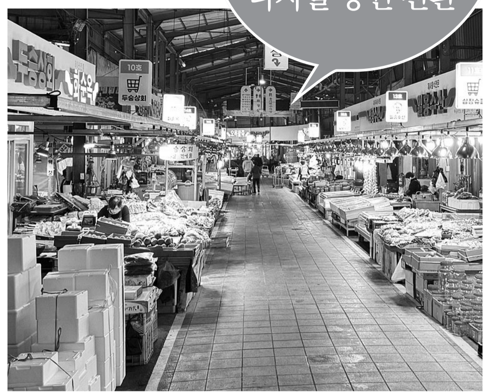
정음시와 카카오의 협업을 통해 디지털상권으로 전환을 모색하는 정음 샘고을시장.

'단골거리 디지털 전환' 선정 구도심 소상공인 온라인 교육 카카오톡 채널 활용 마케팅