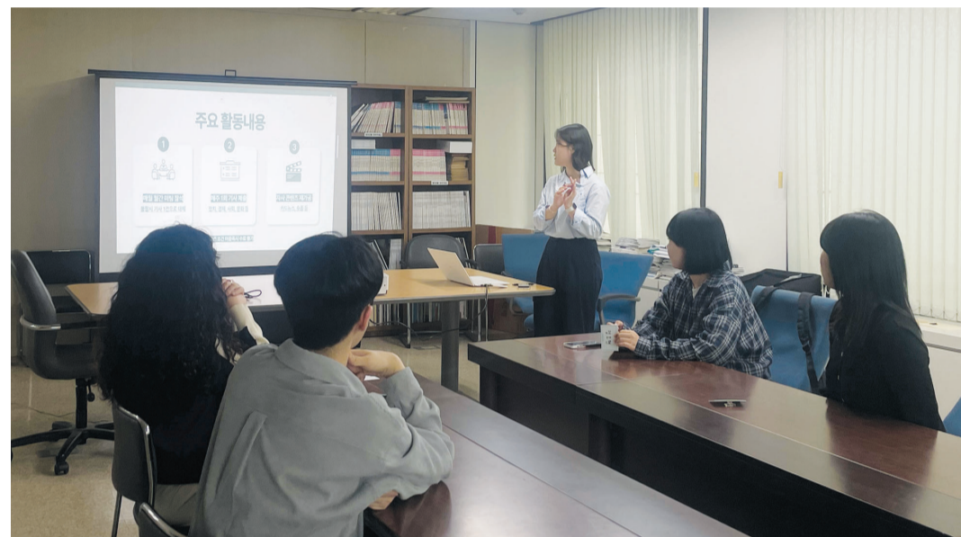
광주일보는 2일 본사 편집국 회의실에서 ‘제2기 광주일보 대학생 기자단’ 출범식을 가졌다. 광주일보는 뉴미디어 시대를 선도하는 지역 언론으로서 변화하는 언론 환경에 맞물려 대학생 기자단 운영에 나선다.