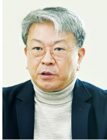
12기 광주일보 리더스아카데미 원우회장도 맡아 활동하게 됐다.

김 교수는 인터넷 등 다양한 미디어가 관심을 끌고 있기는 하지만 ‘신문’만이 갖고 있는 장점이 많으며 지방지만이 할 수 있는 역할을 강조했다. 정치·경제·사회·문화 등 다양한 분야의 지역 사회 소식과