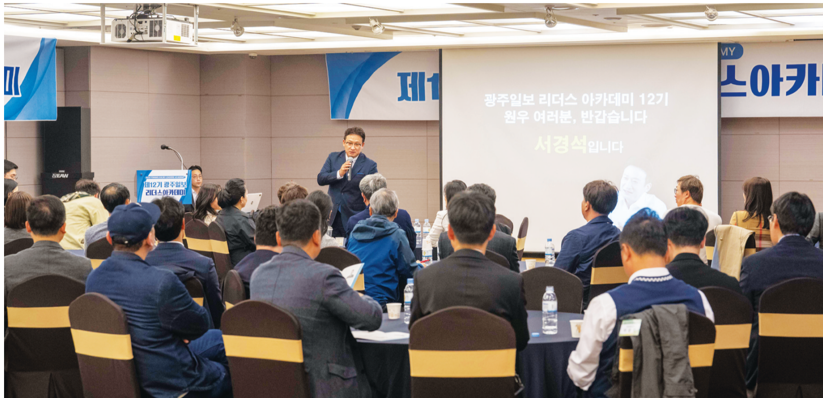
제12기 광주일보 리더스아카데미가 열린 지난 2일 광주시 서구 라마다플라자 광주호텔에서 방송인 서경석씨가 '역사에서 배우는 리더의 소양'이라는 주제로 강연을 펼치고 있다.

방송인 서경석씨가 지난 2일 광주 시 서구 라마다플라자 광주호텔에서 열린 제12기 광주일보 리더스아카데미 강사로 나섰다. 이날 진행된 강의에는 40여명의 원우들이 참여했다.