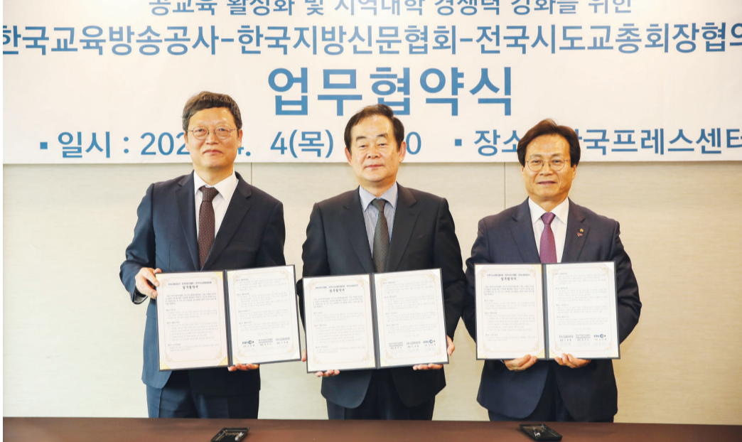
한국지방신문협회와 EBS, 전국시도교총회장협의회가 ‘공교육 활성화 및 지역대학 경쟁력 강화를 위한 업무협약’을 체결했다. <한신협 제공>

세 기관은 이날부터 ‘철수야 대학가자’ 대학입시 어플 사업을 공동으로 진행하며 지역 기반 교육문화 사업을 펼치기로 약속했다. 이와 함께 ▲학령인구 감소에 대비한 지역 교육 문제 해결을 위한 공동 대응 방안 모색 ▲공교육 활성화 및 교원강화를 위한 다양한 협력 방안 마련 ▲지역 기반 교육문화 사업을 위한 공동사업 발굴 및 추진을 협의하기로 했다.