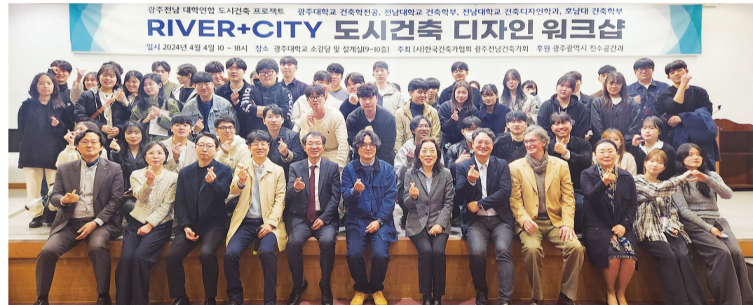
광주-전남 대학 연합 프로젝트인 2024 건축도시디자인 워크숍 ‘리버시티(River+City)’가 (사)한국건축가협회 광주전남건축가회(회장 이순미) 주최로 4일 광주대 호심관에서 전남대와 광주대 등 4개 대학 건축학 전공 교수와 학생, 전문가 등 80여 명이 참석한 가운데 열렸다.