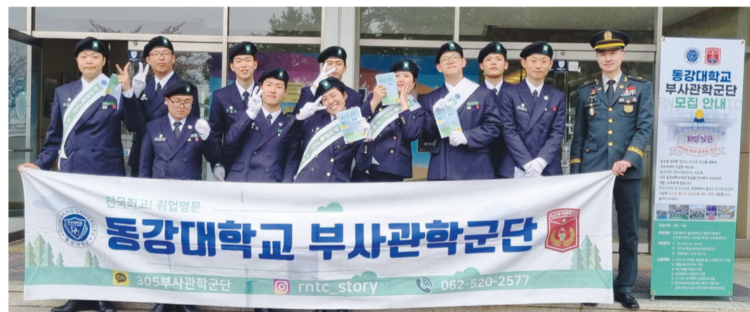
동강대학교(총장 이민숙) 제305학생군사교육단 RNTC가 4일 자연친화 활동을 진행하며 'ESG(환경-사회-지배구조)'를 실천했다.