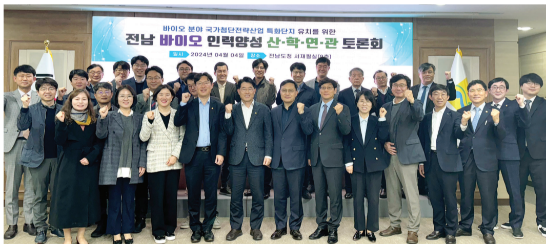
지난 4월 4일 전남도청 서재필실에서 열린 바이오 우수 인력 양성 산·학·연·관 토론회 참석자들. 이날 토론회는 전남바이오진흥원이 중심이 돼 대학, 전문기관, 기업 등 참여해 연간 1000여 명의 국내외 바이오 우수 인력 양성 방안을 논의했다.

전남도가 생물, 즉 바이오산업의 가능성을 깨닫고 본격적으로 바이오산업 생태계 구축에 나선 것이 2000년대 들어서다. 그 첫 단추는 2002년 생물산업육성정책의 제정과 함께 설립된 전남생물산업진흥재단, 지금의 재단법인 전남바이오진흥원의 전신이었다. 더디지만 20여 년간 전남은 이 재단을 중심으로 화순에 병원, 연구기관, 기업 등 바이오산업의 주축 요소들을 결집시켜 바이오 클러스터를 완성해냈다.