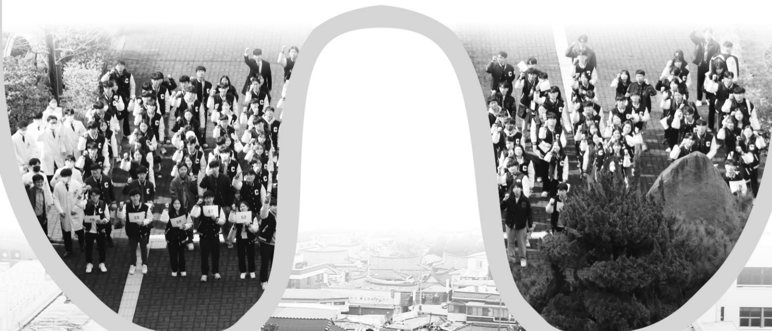
◀조선대 치과대학 치호인행사에 참석한 신입생들. ▼조선대학교 치과대학 전경.