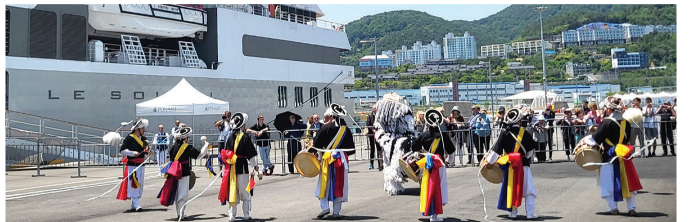
지난해 여수항에 입항한 1만900t급 국제 크루즈선 '르솔레알' 호를 환영하는 행사가 펼쳐지고 있다.

대규모 국제행사를 치러온 여수시는 고부가가치 전시 복합 산업인 마이스(MICE) 육성에도 열심이다. 여수시는 '남해안 거점 마이스 국제회의 도시'를 내