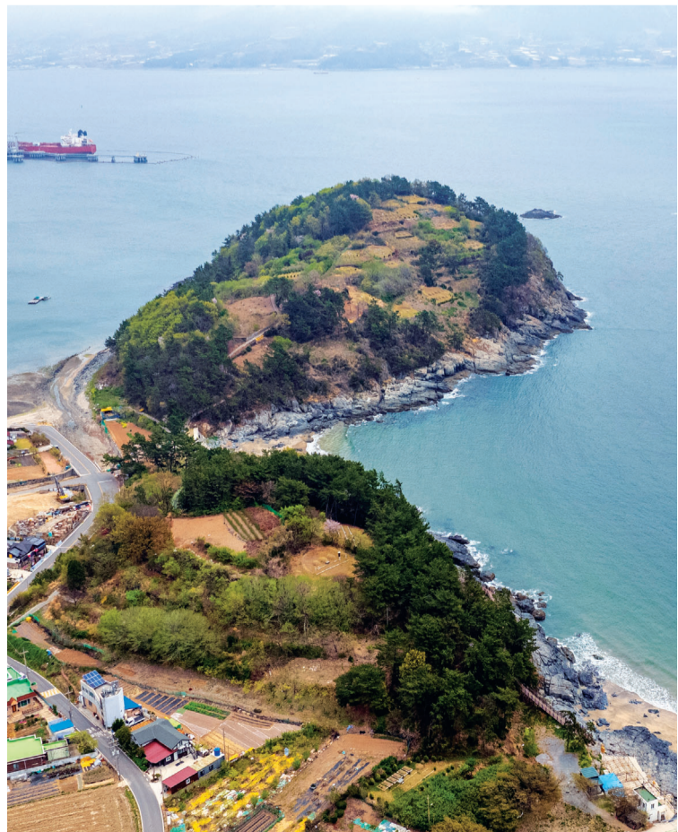
남해안 관광사업에 속도를 붙일 여수~남해 해저터널 건립 부지.

국내 대표 해양관광도시 여수시가 명실상부한 국제 해양관광 휴양도시 도약을 위한 관광사업 본격화에 나섰다.