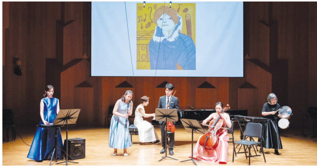
지난 20일 서울 예술의전당에서 열린 가온 솔로이스츠 공연 모습.

첫 곡은 국내에서 좀처럼 접하기 어려운 아르메니아의 국민 작곡가 코미타스의 작품 'Armenian Miniature'이 장식했다. 이어 경쾌한 느낌을 전하는 하이든의 '현악 사중주 D장조' 중 1악장, 노후희의 '국화꽃 향기'와 '다이아몬드 스트리트', 드라마 '일타강사' OST '반대편' 등이 연주됐다. 관객들에게 익숙한 곡들도 선보였다. 영화 '오즈의 마법사' 삽입곡인 '오버 더 레인보우'와 흥겨운 리듬이 일품인 피아졸라의 '리베르탱고'가 피날레를 장식했다. 또 자폐성 발달장애, 다운증후군 등 발달장애 단원으로 구성된 은누리사랑챔버 오케스트라도 찬조출연해 무대를 빛냈다. 연주회가 열리는 동안 아르메니아 출신인 해본 케복 무라드가 이번 공연을 위해 작업한 미디어 아트 신작이 공개됐으며 드라마 '우리들의 블루스'에서 배우로 출연했던 화가 정은혜의 글과 그림도 소개됐다. 가온 솔로이스츠는 첼리스트 요요마와 함께 하는 대통령실 초청 연주와 효성컬처시리즈의 일환으로 진행된 오은영의 토크 콘서트 '동행'에 출연하는 등 다양한 공연을 펼치고 있다. 또 2023년 한국문화예