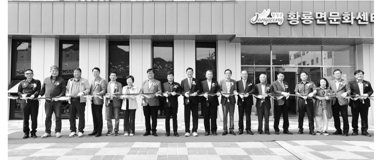
장성군이 지난 19일 황룡면 문화센터 준공식을 열고 김한중 군수 등 관계 자들과 기념촬영을 하고 있다.

황룡시장 인근에는 '황룡소통광장' (장산리 9- 23)을 열어 시장 고객과 주민을 위한 교류·휴식 공 간을 마련했다. 주차장 166개 면과 녹지, 보행로, 팔각정, 의자 등을 설치했다.