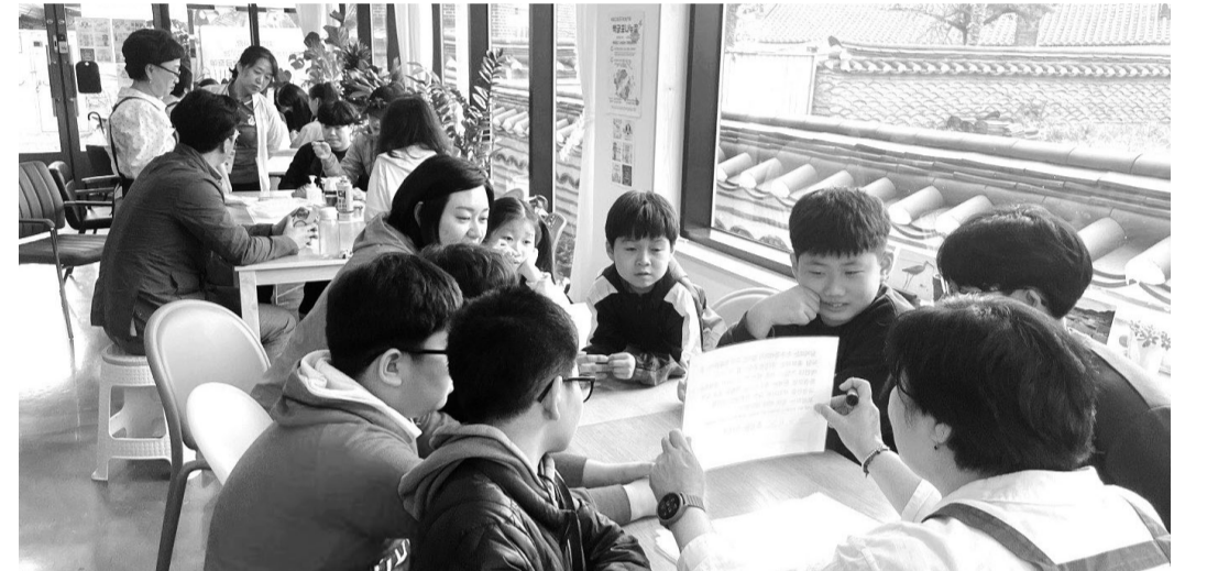
지난 21일 광주지역 어린이와 시민들이 강진군 '푸소생태탐험대 1기' 체험을 하고 있다.