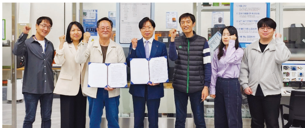
국립목포대학교(총장 송하철) 창업혁신센터는 전남벤처포럼(회장 황헌수)과 지난 22일 스타트업-중소기업의 성장을 촉진하기 위한 협약을 체결했다.