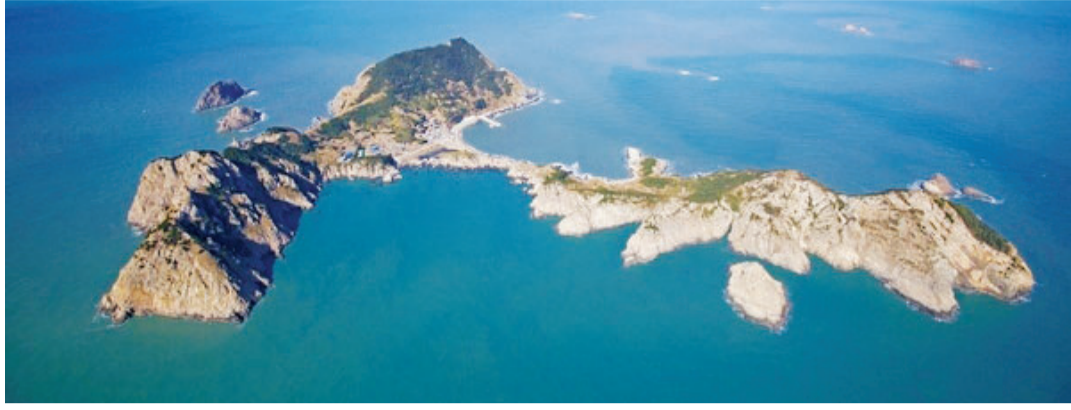
경관적·학술적 가치가 뛰어나 천연기념물 지정을 앞두고 있는 신안 만재도 주상절리.

“주상절리에 사람들이 더 올 수 있도록 주민들과 협력하겠습니다. 장바위 산 등에 탐방로를 내 트레킹 하며 주상절리를 잘 볼 수 있도록 탐방로를 설치