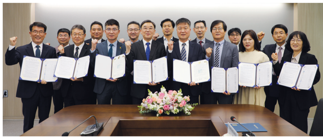
조선이공대학교가 지난 25일 광주지방고용노동청, 광주시교육청, 광주 13개 특성화고·마이스터고등학교와 함께 ‘고교생 맞춤형 고용서비스’ 업무 협약을 체결했다.