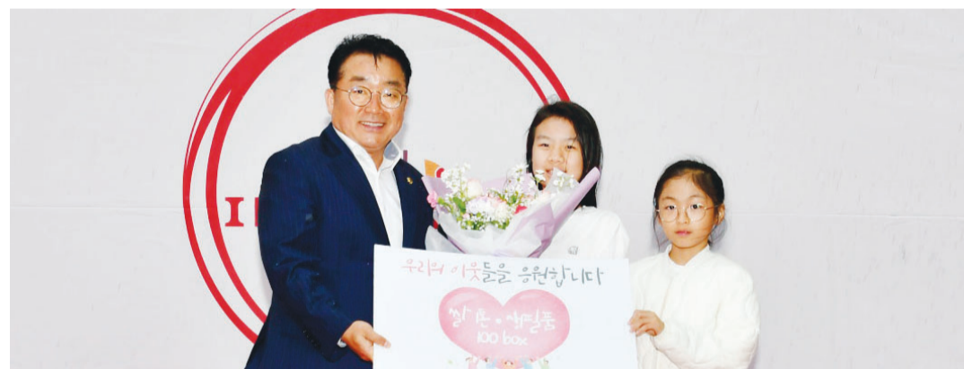
광주 계림아이파크SK뷰 입주자대표회의는 최근 입주 2주년을 맞아 진행한 기념 행사에서 협력업체로부터 지원받은 쌀 1t과 생필품 100박스를 광주재능기부센터에 전달했다.