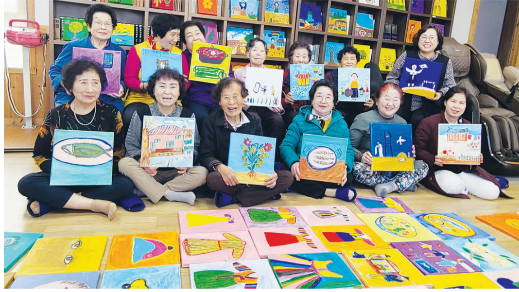
오월어머니들이 직접 그린 작품을 들고 활짝 웃고 있다.

예전에는 잃은 가족을 아름답게 기억하는 그림, 내 마음속 아픔을 정리하는 그림을 그렸다면 최근